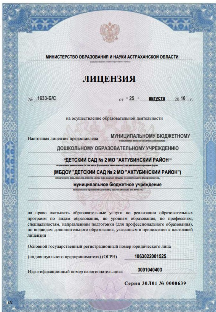
Рис. 1 Лицензия МБДОУ «Детский сад № 2 МО «Ахтубинский район»